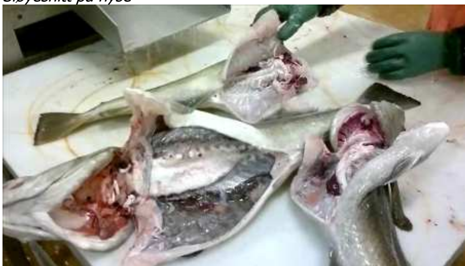
Sløyesnitt på torsk

Store deler av sloget henger igjen i kverken (halsen) når fisken kommer ut av maskinen og delvis også etter gatten. Erfaringen tilsier at sloget stort sett «slipper» i gatten dersom sloget først «slipper» taket ved kverken. For å få alt sloget til å «slippe» etter sløyning er det meget viktig å få kuttet kverken nøye. Den prosessen er ikke så enkel å få til under bløggingen selv om det har blitt påpekt overfor fiskere at kuttet må gå dypere.