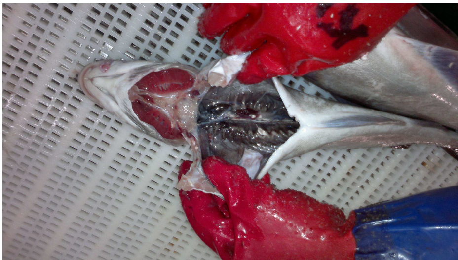
Sløyesnitt på hyse